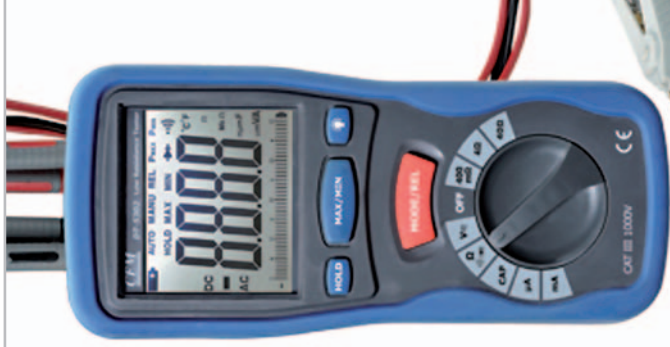
CEM DT - 5302