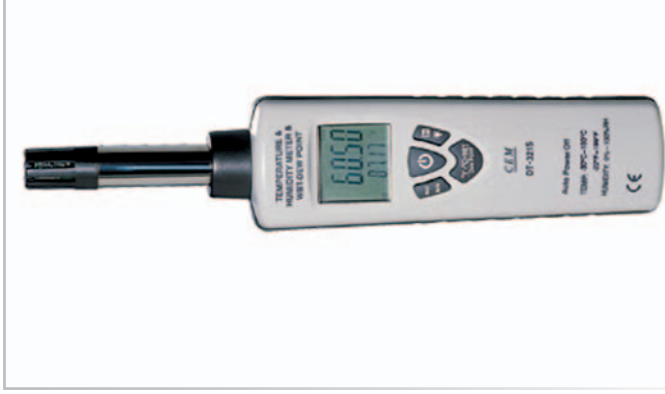
DT – 321S