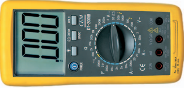
DT - 2005 B