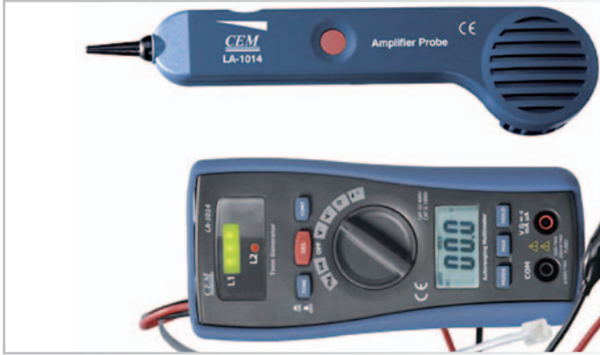
LA – 1014