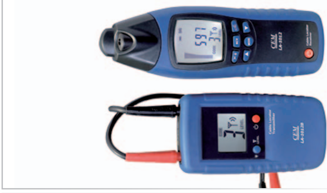
LA – 1012