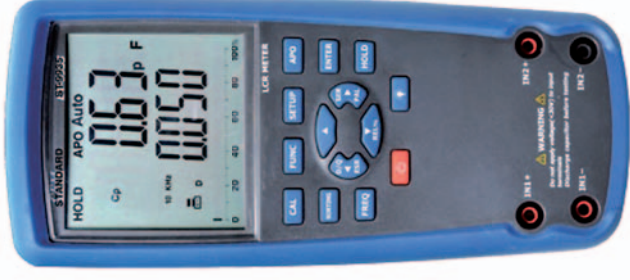
DT - 9935