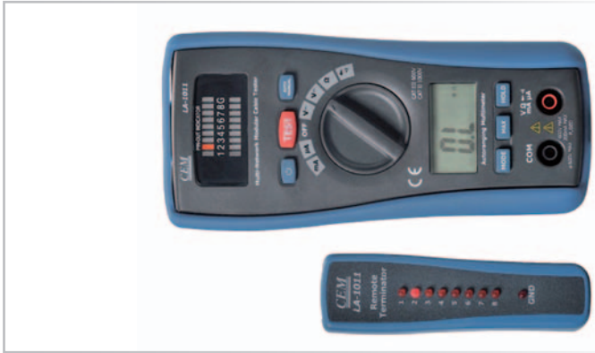
LA – 1011